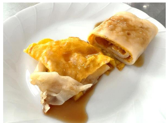
ワールドキッチンで調理した台湾料理ダンピン