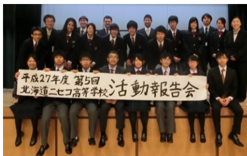
今後ともご協力をよろしくお願い致します