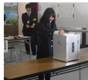
それぞれに役割が与えられ模擬投票しました