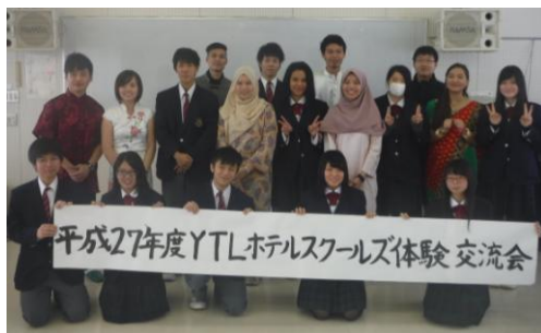
見学旅行での交流会も楽しみです