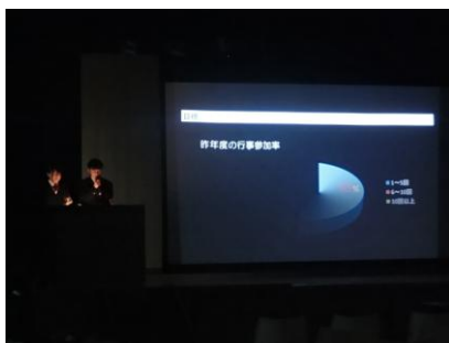
今年度の農業クラブ発表

1年生も2年生も、緊張感を持ちながら堂々と成果や課題を発表していました。次年度の活動がさらに充実したものになるという期待を持たせてくれる発表会となりました。