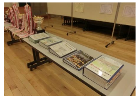
記録簿と各種大会トロフィー