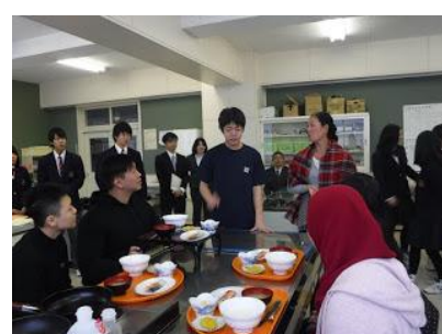
日本の朝食を提供しました