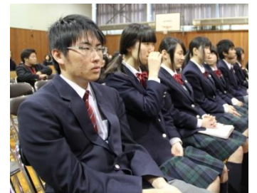
結果発表前の緊張