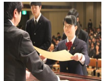
笑顔が輝いていました