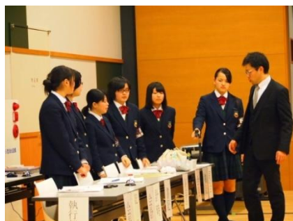
農業クラブ執行部が企画・運営