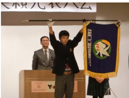
伝統の証 ニ高農業クラブ旗