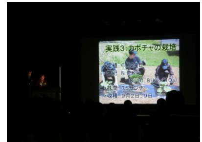
かぼちゃの栽培をテーマにした1年生