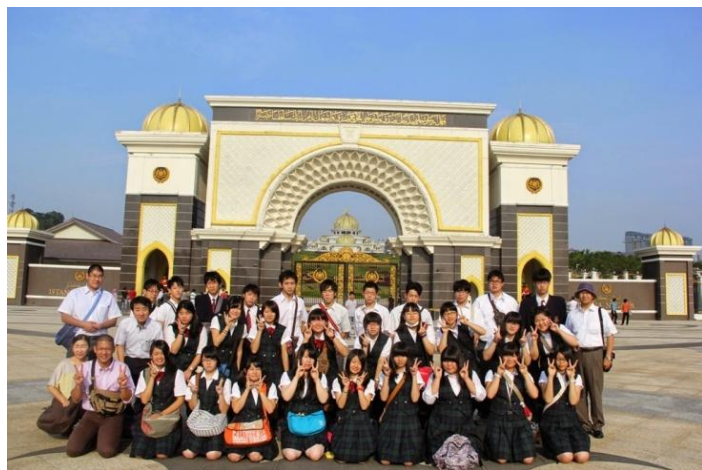
新王宮での記念撮影

2年生が見学旅行でマレーシアを訪れました。モスク（イスラム教寺院）を見学したり、マレーシア料理を食べたりして、文化の違いに触れました。恒例となったYTL-ICHM（クアラルンプールのホテルスクール）の生徒さんたちとの交流会も大いに盛り上がり、あっという間に時間が過ぎました。