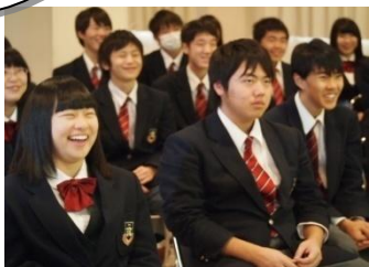
1年生 みんな笑顔でニッコニコ