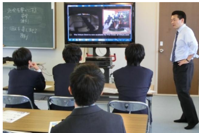
北海道情報専門学校の説明会

同日放課後には生徒向けと保護者向けの進路説明会も実施しました。進路のことをしっかりと考える機会になりました。