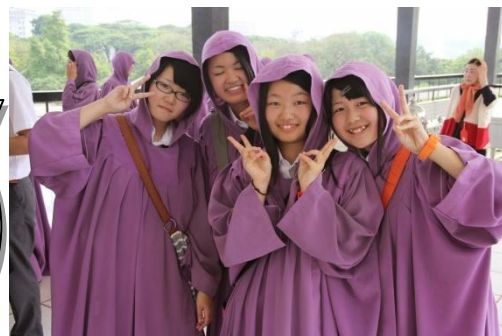
肌を隠す為にローブを着用します