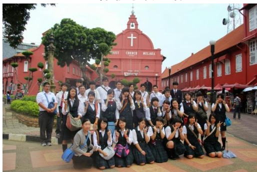
マラッカの教会前にて撮影